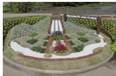
2015 年あいちフェアの札幌市花壇。冬季オリンピック誘致に向け、大倉山と基盤の目街並みを表現した。

全国都市緑化フェアは毎年国内の都市公園で開催される花と緑の祭典です。自治体花壇の出展に札幌市として毎年参加しており、平成29年3月に横浜市で開催される「よこはまフェア」に出展するため、花壇デザイン検討会を立ち上げることにしました。「札幌の魅力」を花壇で表現し全国にPRしてみませんか？自分たちで考えた花壇が形になるまでを見ることができる貴重な機会にもなります。興味のある方はお気軽に事務局までお問い合わせください。（締切 10/8）