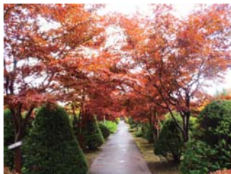
紅葉のトンネルは圧巻